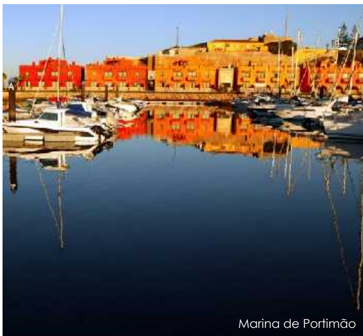
Marina de Portimão