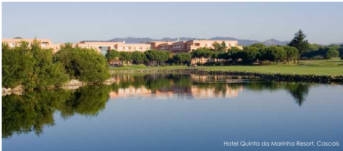
Hotel Quinta da Marinha Resort, Cascais

DUCTOS, SOCIEDADE DE PROJECTOS DE ENGENHARIA, LDA. , constituiu-se em Sociedade por quotas em Julho de 1992, em resultado da já longa colaboração entre os sócios, colaboradores e consultores, na elaboração e execução de estudos e projectos para entidades públicas e privadas.