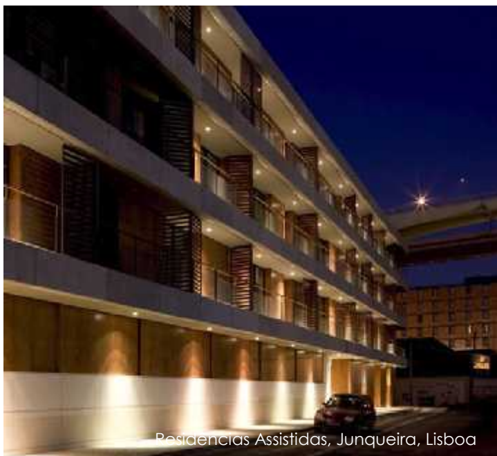
Residências Assistidas, Junqueira, Lisboa